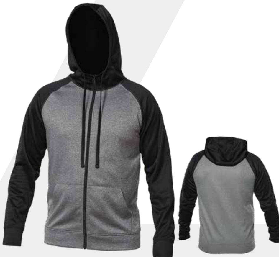
DEVANT | FRONT