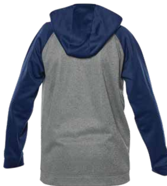
MARINE / MIX GRIS | NAVY / MIX GREY - DOS | BACK