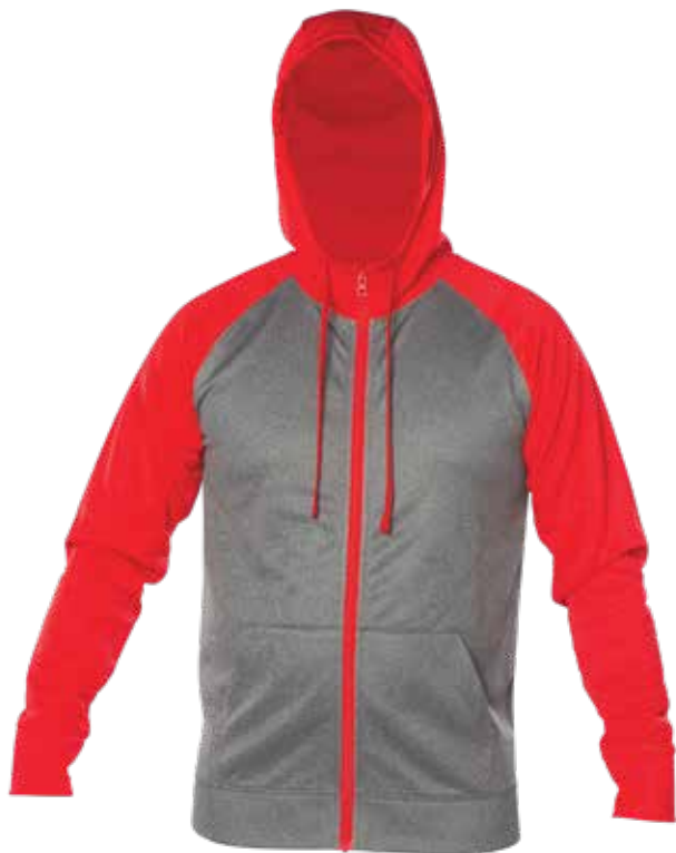
ROUGE / MIX GRIS | RED / MIX GREY - DEVANT | FRONT