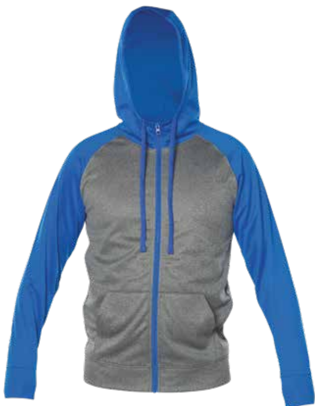
BLEU ROYAL / MIX GRIS | ROYAL BLUE / MIX GREY - DEVANT | FRONT