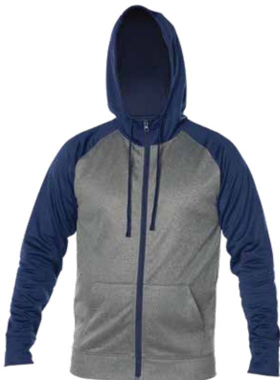
MARINE / MIX GRIS | NAVY / MIX GREY - DEVANT | FRONT