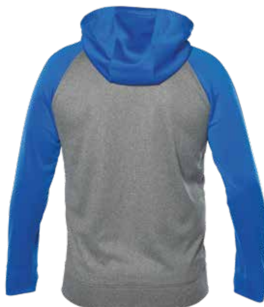
BLEU ROYAL / MIX GRIS | ROYAL BLUE / MIX GREY - DOS | BACK