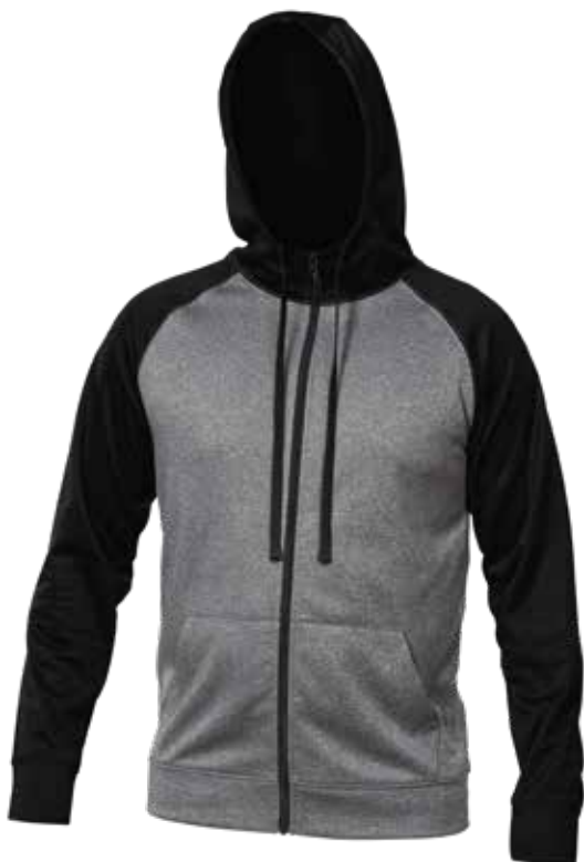
NOIR / MIX GRIS | BLACK / MIX GREY - DEVANT | FRONT