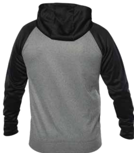
NOIR / MIX GRIS | BLACK / MIX GREY - DOS | BACK