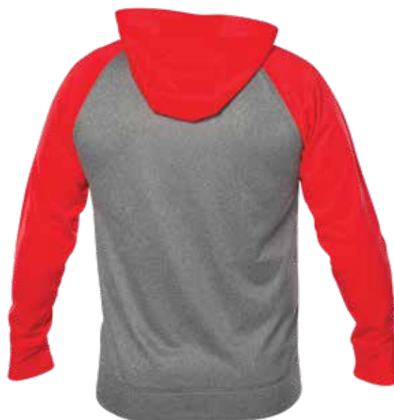
ROUGE / MIX GRIS | RED / MIX GREY - DOS | BACK