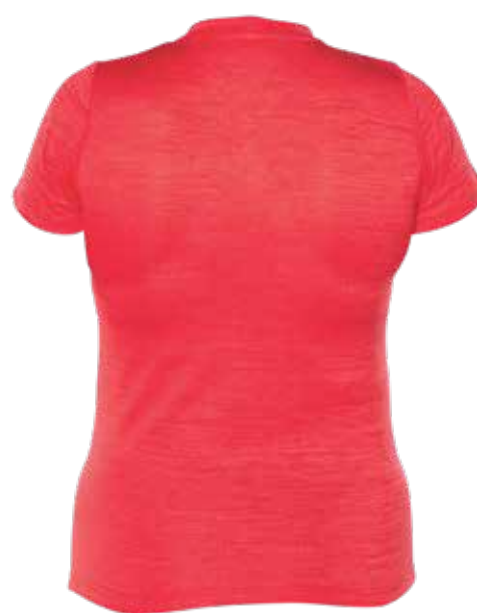
MIX ROUGE | MIX RED - DOS | BACK