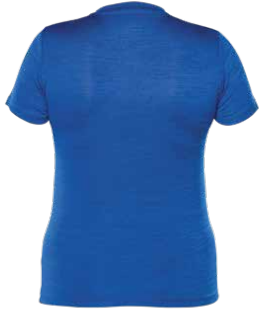
MIX BLEU | MIX BLUE - DOS | BACK