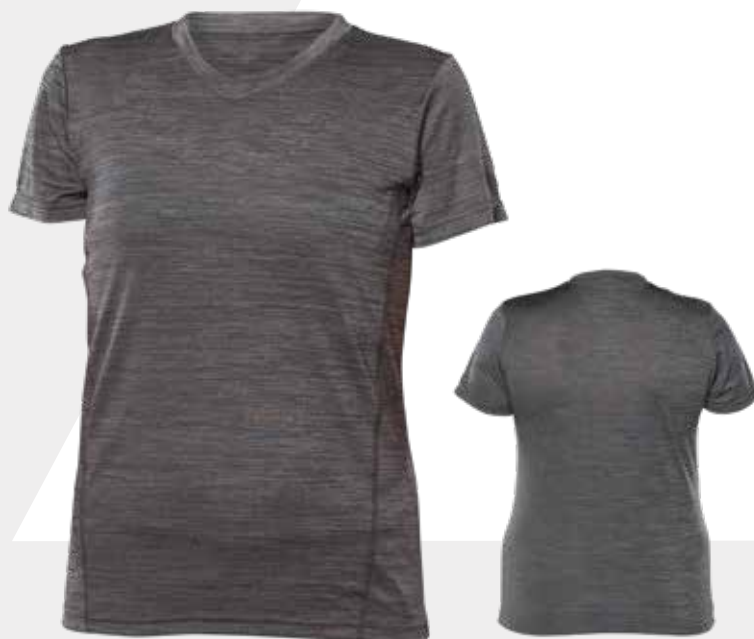
DEVANT | FRONT