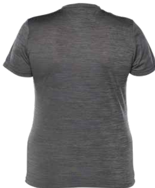
MIX GRIS | MIX GREY - DOS | BACK