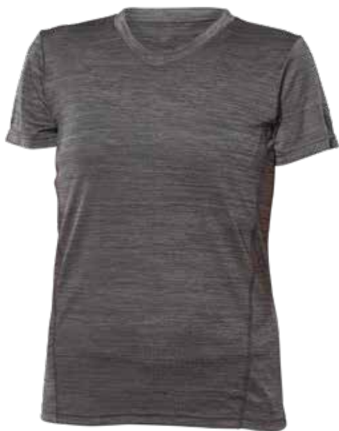
MIX GRIS | MIX GREY - DEVANT | FRONT