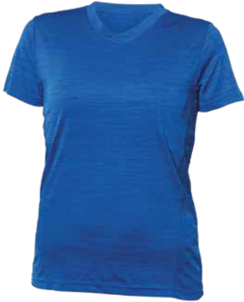
MIX BLEU | MIX BLUE - DEVANT | FRONT