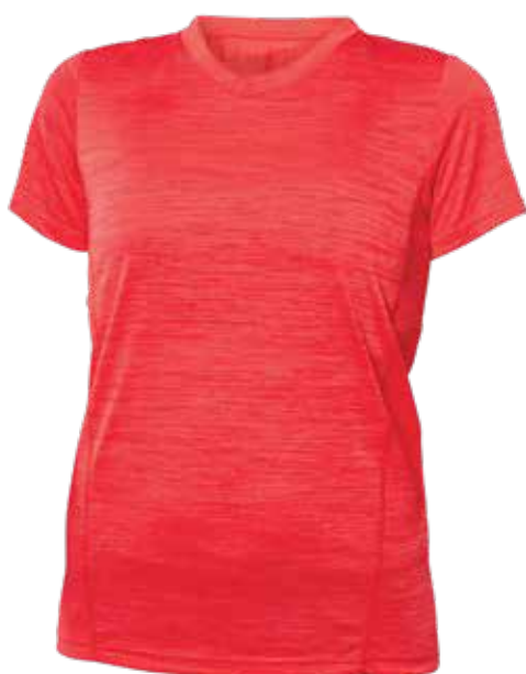
MIX ROUGE | MIX RED - DEVANT | FRONT