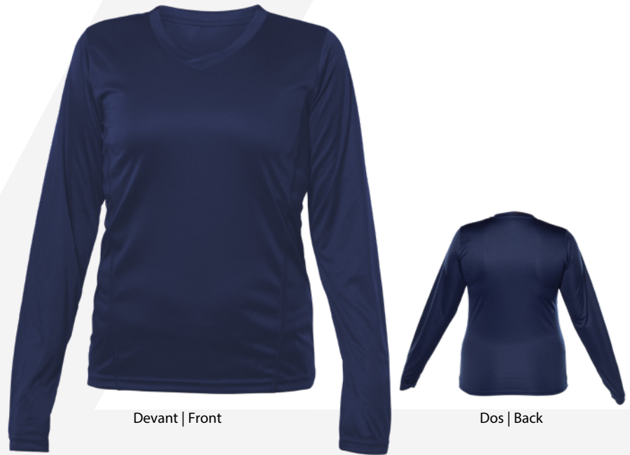
Devant | Front

⚠ En raison de la nature des tissus 100% polyester, un soin particulier doit être apporté tout au long du processus de sérigraphie. Due to the nature of 100% polyester fabrics, special care must be taken throughout the screen printing process.